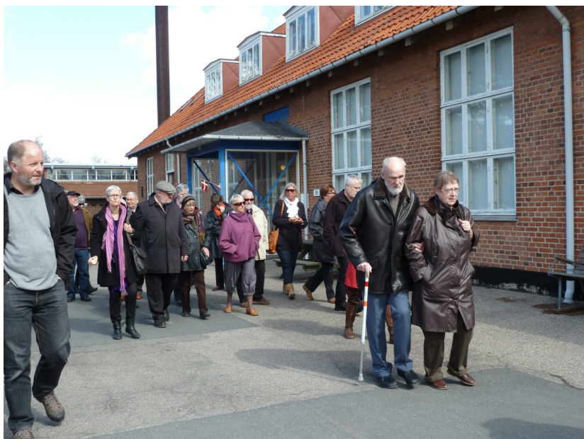
Rundvisning på det tidligere Andersvænge