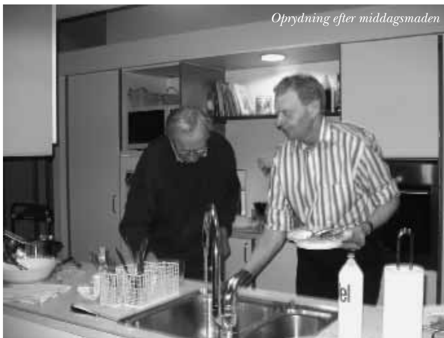
Oprydning efter middagsmaden

Fast ligger det dog at alle tilbydes at komme på ferie, og her er det altid spændende om nogle kunne tænke sig at komme det samme sted hen. I år går turen til Tyrkiet, og forventningens glæde er stor.