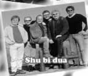
Shu bi dua