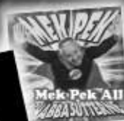
Mek-Pek All stars