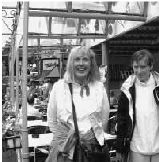
Tur til Bakken