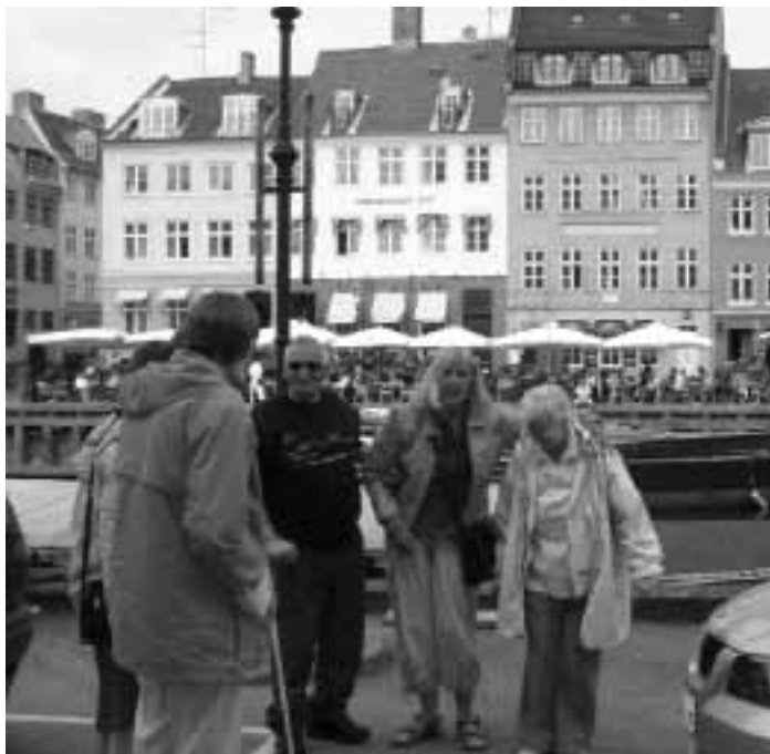
Nyhavn og kanalrundfart